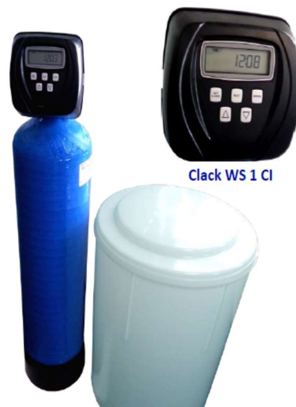
Clack WS 1 CI